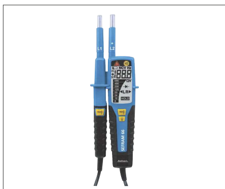
Sefram 66 : VAT / DDT jusqu'à 1000 V AC et 1500 V DC