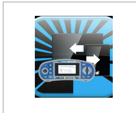
A1431 : Licence EuroLink Android®