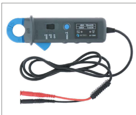
A1391 : Pince AC/DC 300A