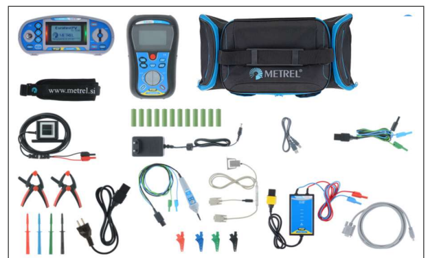
Un jeu d'accessoires complets livré en standard