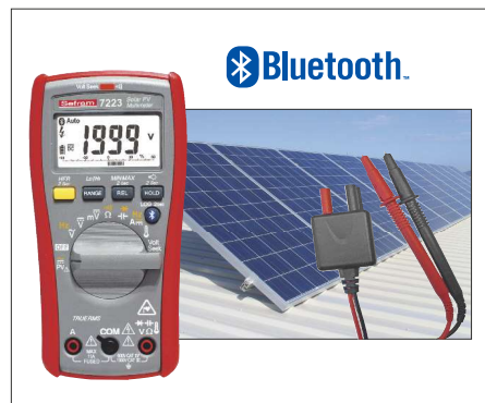
Sefram 7223 + SA163 : Complétez votre ensemble de test avec un multimètre communiquant dédié au photovoltaïque.