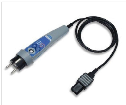
A1314 : Sonde active 2P+T