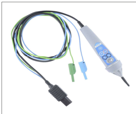
A1401 : Sonde active type pointe de touche