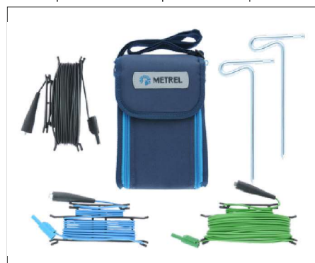
S2026 : Kit de mesure de terre avec piquets