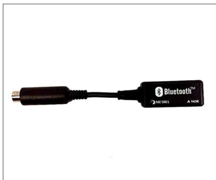
A1436 : Dongle Bluetooth pour communication entre les appareils